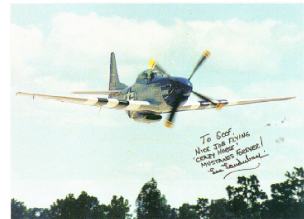
Het bewijs van de vlucht, de handtekening van de meester.