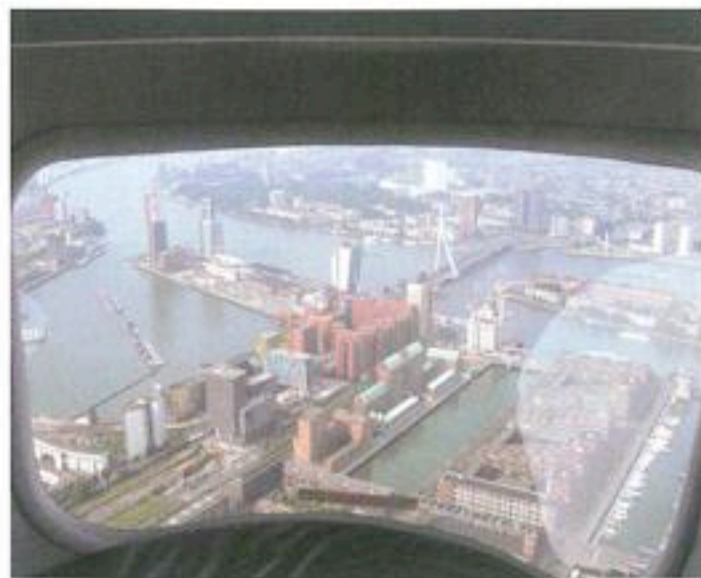
Rotterdam vanaf het bankje in de achtersteven.