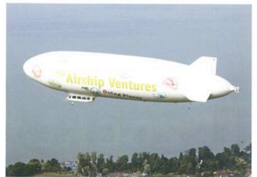
In Amerika is de NT al door de FAA gecertificeerd.

De zeppelin blijkt ook tijdens deze ferry zeer