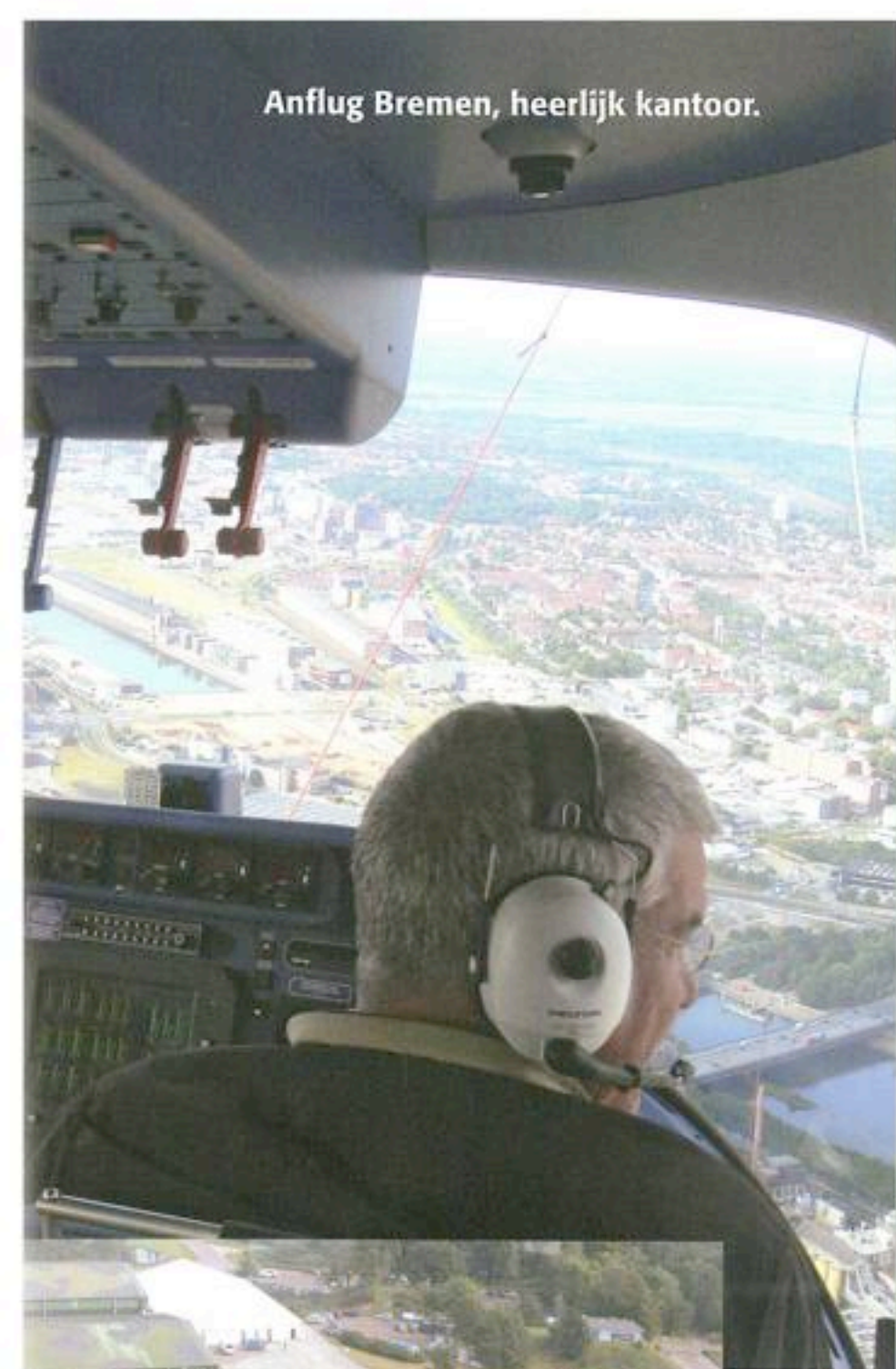
Anflug Bremen, heerlijk kantoor.