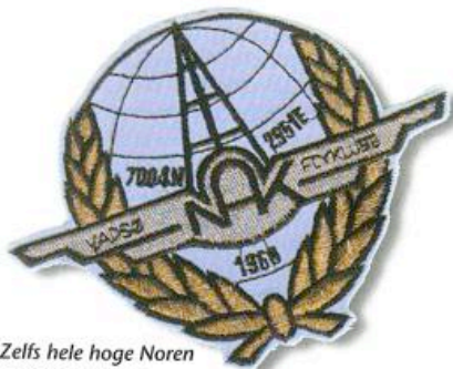
Zelfs hele hoge Noren waren gekomen.