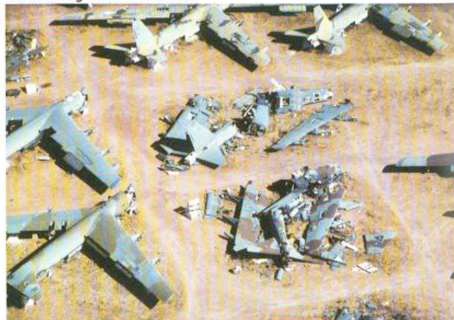
De vernietiging van B52's boven AMARC in verband met de uitvoering van het STAR-verdrag.

informatie weg, zoals de aankomst van de verdachten voor het Joegoslavië-tribunaal. Goed beschouwd krijgen spotters desondanks heel wat meer mee van de internationale ontwikkelingen dan de gemiddelde Nederlander. Bezoeken van grote politieke leiders worden weken van tevoren aangekondigd. Met name Valkenburg is daarvoor interessant, want daar komen die hoge heren en dames vaak neder. Zoals het bezoek van de Koreaanse president, die Hiddink de hand kwam schudden, maar verder niemand hoefde te zien. En het overlijden van Claus, hoe treurig ook, dat toch weer een aantal bijzondere toestellen naar Nederland bracht. Minder vrolijke zaken maakt de spotter dan ook intenser mee dan de modale tv-kijker thuis. Frank: "Een van de toestellen van het WTC had ik