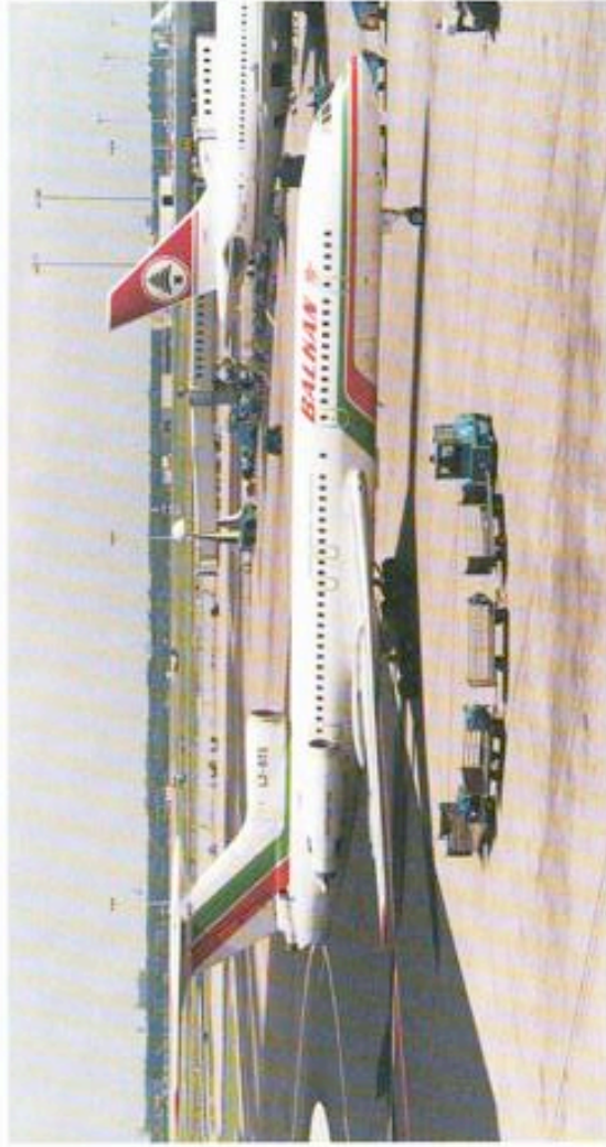
Mijn eerste Tu-154 B2 van Balkan Bulgarian Airlines. De foto werd gemaakt op 22 juli 1992 op Schiphol met mijn eerste camera en mijn eerste rolletje.

auto de velden afschuimen. Zaken worden ook groter aangepakt. Scramble (de zeer actieve vereniging van spotters) en HAT (Holland Aviation Travel) organiseren zelfs spottersreizen. Die vliegen met veertig spotters naar Qatar en zitten dan in de brandende zon de hele dag op het dak van het hotel te kijken naar alles wat daar in die zandbak landt. Of naar Alaska, om met en busje al die kleine veldjes af te stropen. Heerlijk werk, en stukken leuker dan met een discokater op het strand van Torremolinos zitten.