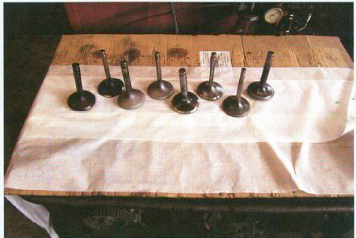
1 Getest tot tevredenheid: Theo Hendriks en hoofd-TD Chiel van de Pijl. 2 De zingende tandarts kennen we, maar een buschauffeur die aan bommenwerpers sleutelt is toch even wat anders. 3 Negen weken sleutelen: de gereviseerde crankcase wordt weer 'gevuld' met de inmiddels in eigen beheer opgeknapte cilinders en bewegende delen. 4 Kleppen slijpen, cilinders honen, klepzittingen leppen: deze motor heeft inmiddels alweer 150 uur gedraaid.

lang. Daarna konden ze me uitwringen, maar ik was geslaagd.”