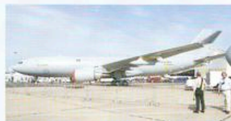
De A330 Multi Role Tanker Transport (MRTT) vloog op 15 juni voor het eerst, maar was alleen op static te zien in Parijs. Het toestel is uitgerust met centerline ARBS (Air Refueling Boom System) en een beschermings-systeem tegen raketten.