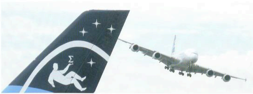
De 380 toert boven de staart van deze vomit-comet, de Zero-gravity Airbus 330.