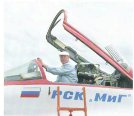
Petje en lullig jasje: de Russen blijven iets boers houden temidden van alle high-tech.

venture hebben opgericht waarbij Alenia een belang neemt van vijfentwintig procent plus een aandeel in het SSJ-project.