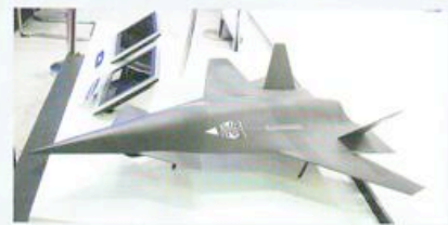
De Chinezen leren snel.