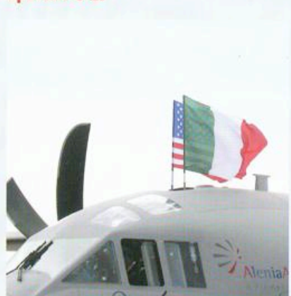
Spartan: heel af en toe (Texan II, Harrier, Slingsby) gaan de Amerikaanse strijdkrachten een Europese relatie aan.