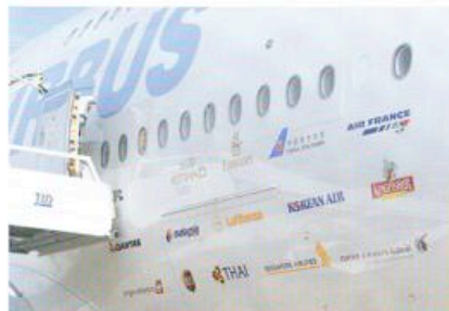
Bijna alle kopers op een kluitje: de 380 beleeft een voorzichtige opleving na een moeizame start.

Voor Airbus was de koek daarmee niet helemaal op: in de week na Parijs werd bekend dat easyJet nog eens 45 extra A319's bestelde. Ook Qatar was toen nog