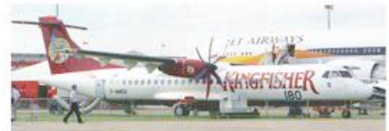
Kingfisher Airlines uit India heeft 35 ATR 72-500's besteld met opties op nog eens twintig. De eerste werd in maart 2006 ontvangen.