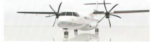
Met de slogan 'proud to be turboprop' voert ATR campagne om de bedrijfseconomische voordelen ten opzichte van regional jets te onderstrepen. ATR noemt zichzelf een 'Green Player' op de regionale markt. Het verbruik op een trip van 330 km zou per passagier vijftien procent minder zijn dan per auto, en zelfs vijftig procent minder dan in een regional jet.