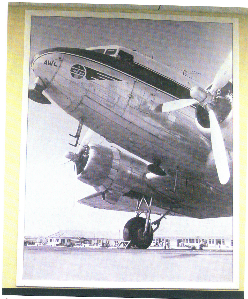
Alleen een grote foto in de hal herinnert nog aan het roemruchte verleden van Sabena.

De toestellen? "Onze Diamond singles zijn perfecte trainingsplatforms. Side stick , heeft de toekomst. Lekker ruim zitten en een volwassen vlieggedrag voor zo'n relatief licht toestel. Natuurlijk, we hebben onze reliability -problemen gehad met de Thielert-motoren, maar die zijn nu verleden tijd. En de ventilatie is op het platform af en toe niet optimaal, haha! De hitte kan je soms parten spelen, daarom houden we bijvoorbeeld de elektrische pomp aan bij het taxiën. In de lucht is het geen probleem, daar heb je voldoende koeling, maar op de grond wil het wel eens te gek worden. En op de hitte die we hier momenteel hebben is natuurlijk geen enkel toestel berekend!"