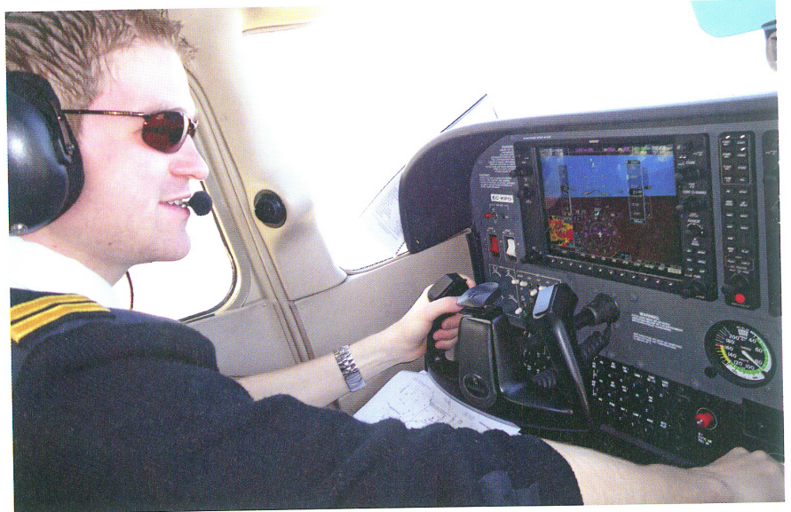
De CAE-Sabena-vliegschool heeft in Arizona meer dan veertig moderne toestellen voor opleidingsdoeleinden beschikbaar.

Het omgekeerde? "Komt ook voor, heimwee, heb je wel, natuurlijk. We hebben iemand wel eens een week naar huis gestuurd, was beter voor hem. Daarna ging het weer goed. Maar omdat we professioneel werken hebben de leerlingen weinig tijd voor wisselwasjes. Safety en competentie, op die twee