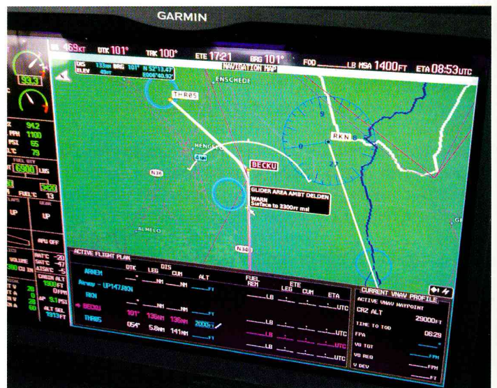
BECKU: gevaar voor gliders bij Ambt Delden.